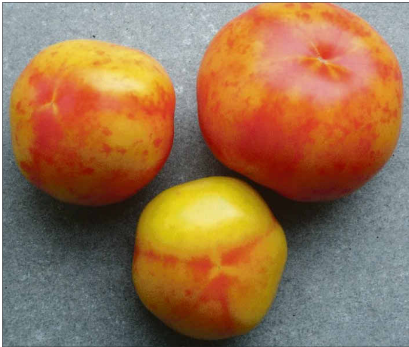
Typische, durch ein aggressives Isolat des Pepinomosavirus verursachtes Symptom: Marmorierte Früchte. Mit PMV-01 kann gegen den am häufigsten vorkommenden Stamm CH2 des Virus vorbeugend geimpft werden.

„Profingemüseanbauer atmen auf. ... Das BVL macht es möglich. Im Profianbau ist die Bekämpfung des Pepinomosavirus in Gewächshäusern jetzt realisierbar.“ machen die Pflanzenschutz-Experten des LTZ (Landwirtschaftliches Technologiezentrum) Augustenberg die Bedeutung der Notfallzulassung deutlich.